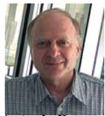
Antonio Ragone (poeta)