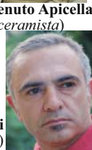
Michele Mari (fotografo)