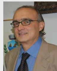
Il sub commissario

Nato a Salerno, sposato con tre figli, si è laureato presso la Facoltà di Economia di Salerno. Dopo una breve esperienza lavorativa presso il CNR di Napoli è entrato nei ruoli dell'Amministrazione dell'Interno nel 1989.