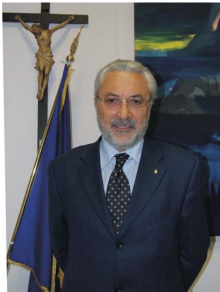
Il commissario Raffaele Cannizzaro

(n.d.r. Equitalia è la società per azioni, a totale capitale pubblico (51% in mano all' e 49% all'Inps), incaricata dell'esercizio dell'attività di riscossione nazionale dei tributi. Il suo fine è quello di contribuire a realizzare una maggiore equità fiscale, dando impulso all'efficacia della riscossione attraverso la riduzione dei costi a carico dello Stato e la semplificazione del rapporto con il contribuente).