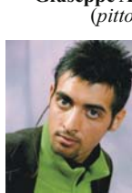
Claudio Collano (attore)